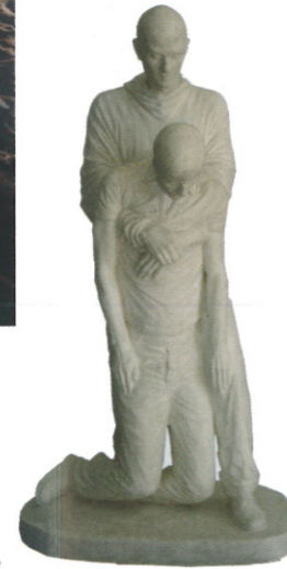
Tarrik Essalhi - sculpture