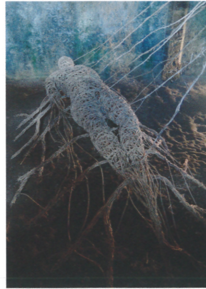
Véronique Matteudi - sculpture végétale