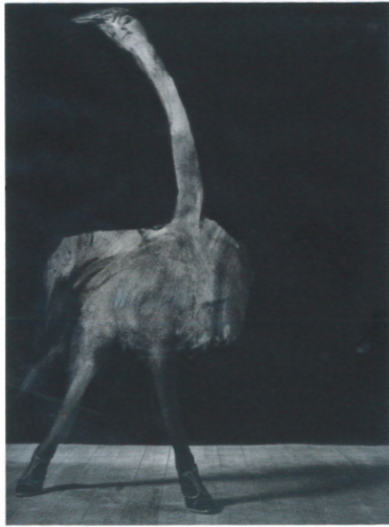
Ral Escalé - peinture sur imprimé